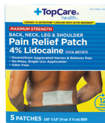
Parche de lidocaína, al 4% Cantidad: 5 unidades