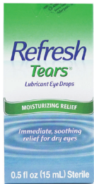
Gotas lubricantes para los ojos, Refresh Tears®, 15 ml. Cantidad: 1 unidad