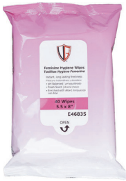
Toallitas para higiene femenina Cantidad: 40 unidades