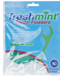
Hilo interdental Cantidad: 90 unidades