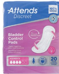
Attends® Discreet, almohadilla para el control de vejiga de absorción moderada para mujeres* Cantidad: 20 unidades