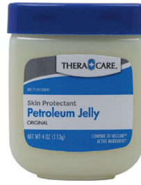
Jalea de petróleo, 4 oz. Cantidad: 1 unidad