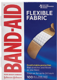
Band-Aids®* Cantidad: 100 unidades