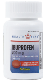
Tabletas de ibuprofeno, 200 mg. Cantidad: 50 unidades