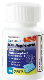
Cápsulas extrafuertes de acetaminofén PM, 500 mg., 25 mg. Cantidad: 50 unidades