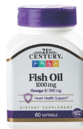
Aceite de pescado en cápsulas blandas, 1,000 mg + Cantidad: 60 unidades