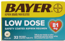
Bayer® aspirina con recubrimiento entérico, dosis baja, 81 mg. Cantidad: 32 unidades