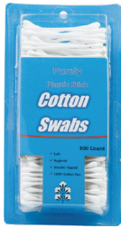
Hisopos de algodón Cantidad: 300 unidades