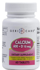
Tabletas de calcio + vitamina D3, 600 mg + Cantidad: 60 unidades