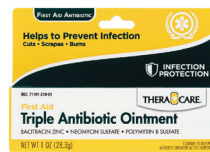
Ungüento con triple antibiótico, 1 oz. Cantidad: 1 unidad