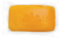
Jabón en barra antibacteriano Cantidad: 1 unidad