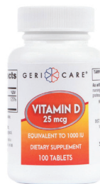
Vitamina D3, 25 mcg † Cantidad: 100 unidades