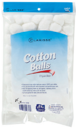
Bolas de algodón Cantidad: 100 unidades