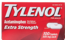
Tylenol® tabletas extrafuertes, 500 mg. Cantidad: 100 unidades