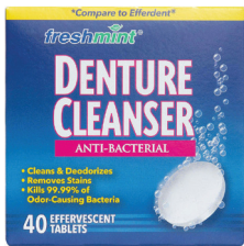
Tabletas para limpieza de dentaduras postizas Cantidad: 40 unidades