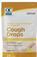
Pastillas para la tos, sin azúcar Cantidad: 25 unidades